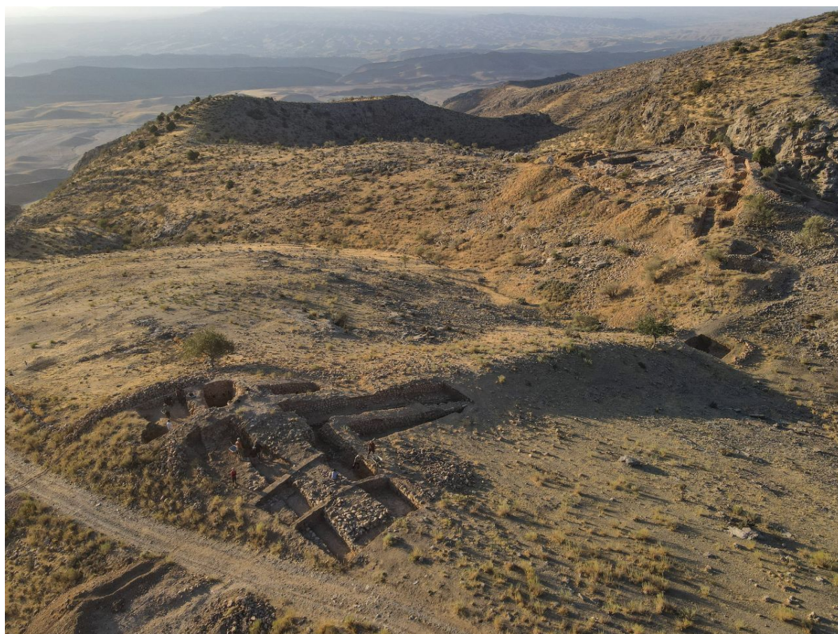
Цитадель крепости Узундара

6. Вышла коллективная монография в семи томах «Археологии Волго-Уралья» – это современный академический взгляд на более чем полуторавековой опыт археологических исследований одного из наиболее значимых и уникальных историко-культурных регионов евразийского континента. В издании представлена археология Волго-Уралья с эпохи камня до позднего средневековья.