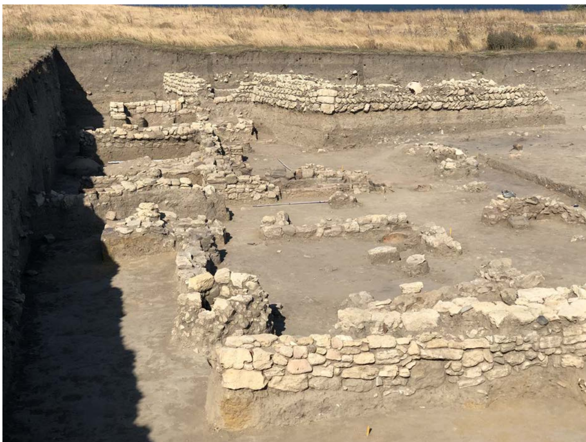
Кварталы византийской Фанагории