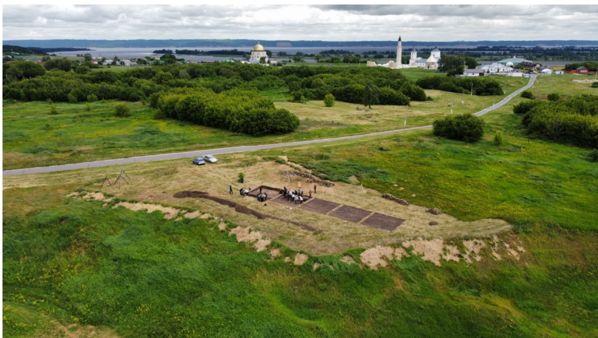
Исследование Болгарского городища