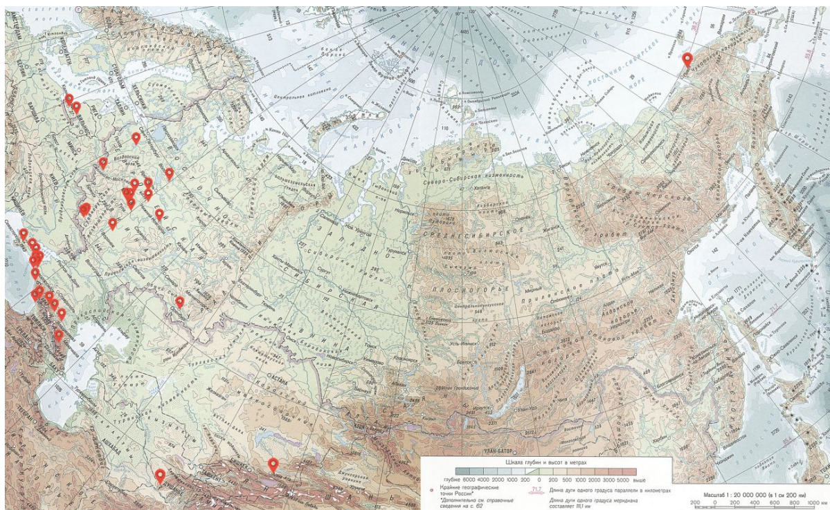
Карта экспедиций Института археологии РАН

«Приток новых археологических материалов – необходимое условие более глубокого и точного научного видения прошлого Евразии. Преддверие Дня археолога, который отмечается 15 августа – время первого представления результатов текущих полевых работ, демонстрации новых находок, подведения предварительных итогов работы экспедиций. Общий объем полевых работ, ведущихся в России в 2022 году значителен: Министерство культуры РФ выдало более 2100 Открытых листов (разрешений) на право производства разведок и раскопок», – сказал Николай Макаров.