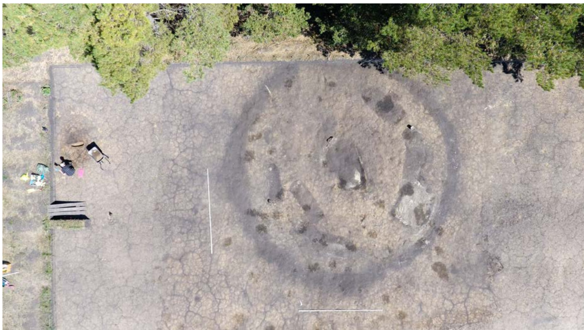
Элитный курган №51 Усть-Тартасского могильника. Саргатская культура, Браба, Западная Сибирь

Западно-Сибирский археологический отряд Института археологии и этнографии Сибирского отделения РАН под руководством академика РАН Вячеслава Молодина при поддержке Российского научного фонда проводит в 2022 году раскопки одного из элитных курганов Усть-тартасского могильника, расположенного в Барабинской лесостепи в Новосибирской области. Огромный некрополь, Усть-тартасский могильник был открыт ещё в конце XIX века С.М. Чугуновым. Им же проведены первые раскопки нескольких сооружений, давшие материалы саргатской культуры эпохи раннего железа (VI–III века до н.э.). К изучению памятника обращались и в советское время. К сожалению, многие насыпи пострадали в XX веке от интенсивной распашки. Работы института предварил геофизический мониторинг, показавший на прилегающей к кургану территории аномалии более древних эпох (неолита и бронзы).